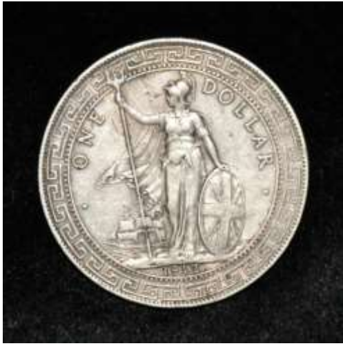
(标准物) 对比 1