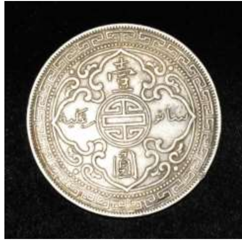
(标准物) 对比 2